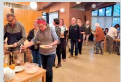
Im Nu bildete sich eine Schlange in der Nachbarschaftsküche